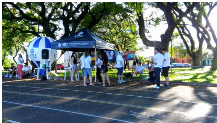
Divulgação do Projeto na Campanha de Vestibular URI-SLG