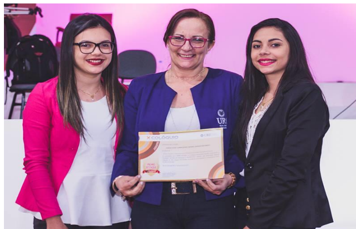
Equipe do Projeto recebendo Prêmio Destaque no X Colóquio, das mãos da Diretora Geral da URI-SLG.