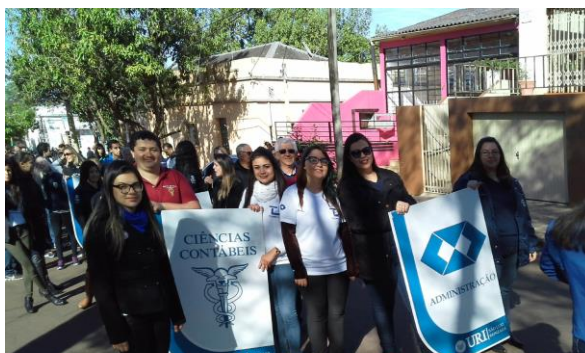
- Participação no Desfile Cívico em 07 de setembro de 2016.