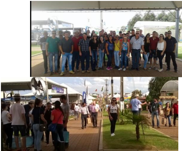
- Encontro das Empresas Talentos Junior e Alternativa Junior em Santiago-RS. 01 de Abril de 2017