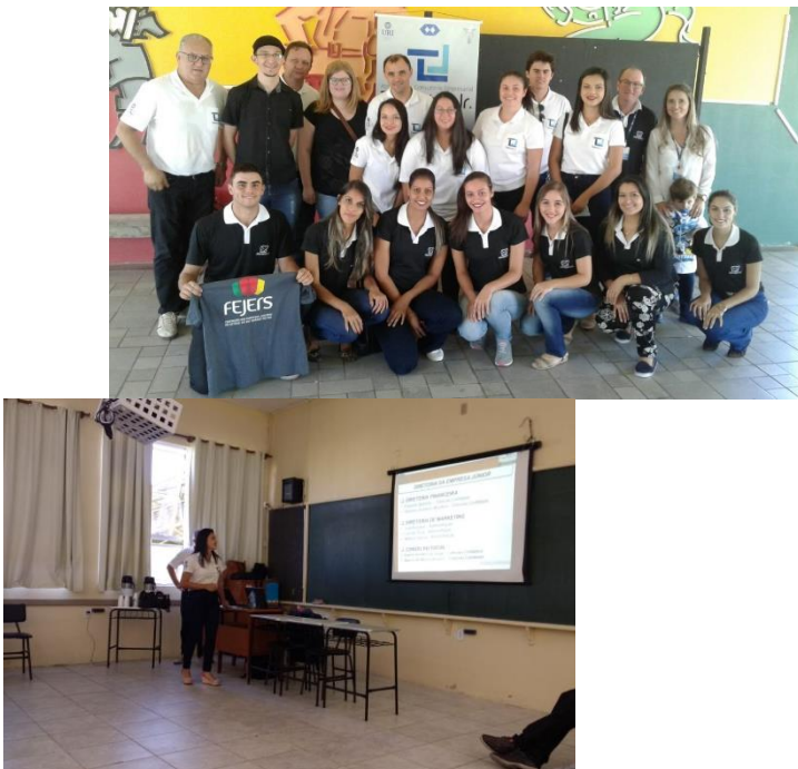
- Participação da XXIII Semana Acadêmica do Curso de Administração. 22 de Maio de 2017.