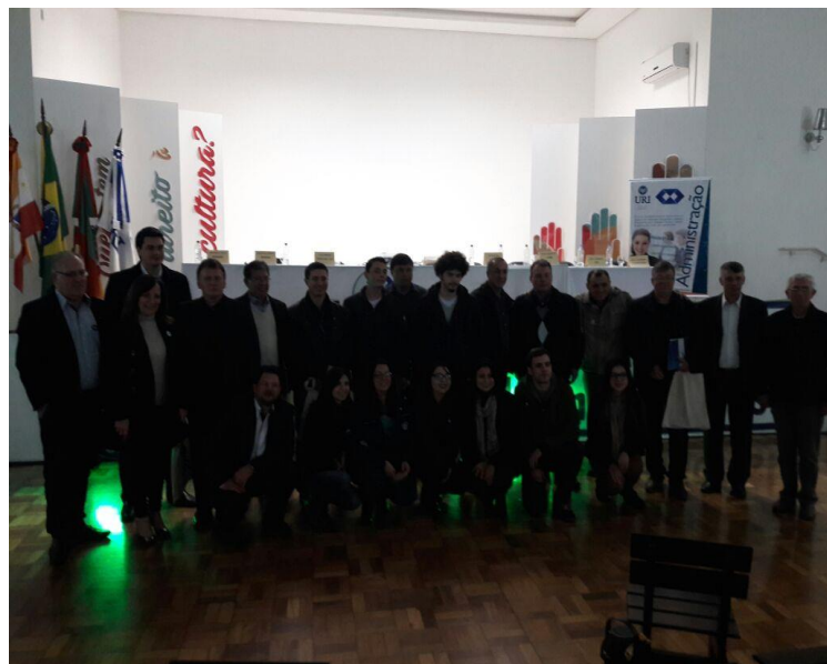
Momentos da Semana Acadêmica

Palavras-chave – Liderança. Organizações. Formação de líderes. Desafios.