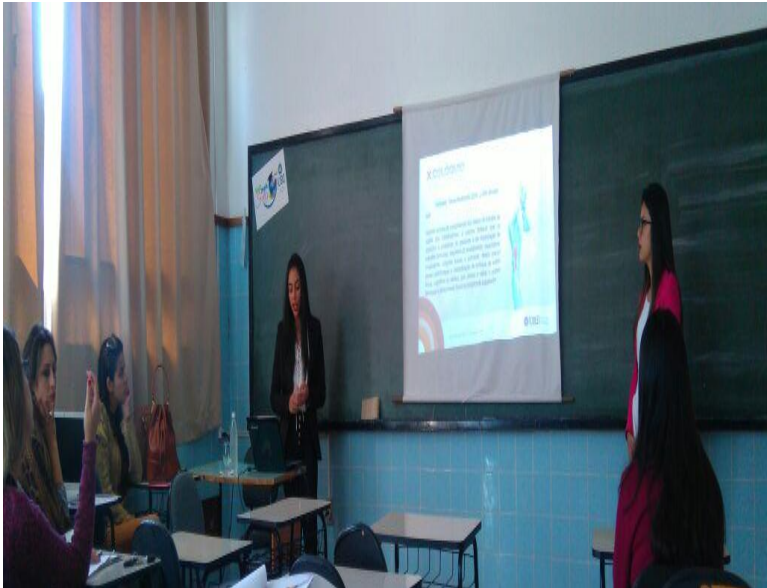
À esquerda, Equipe do Projeto recebendo prêmio destaque no X Colóquio. À direita, momento da apresentação do trabalho.