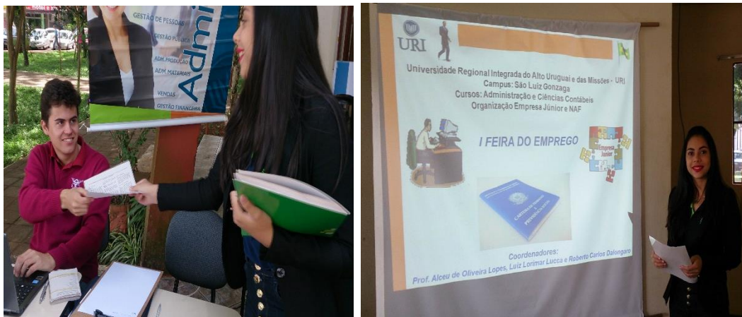
Registro fotográfico da I Feira de Emprego.