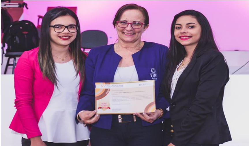
Equipe do Projeto recebendo prêmio destaque no X Colóquio, das mãos da Diretora Geral da URI-SLG.