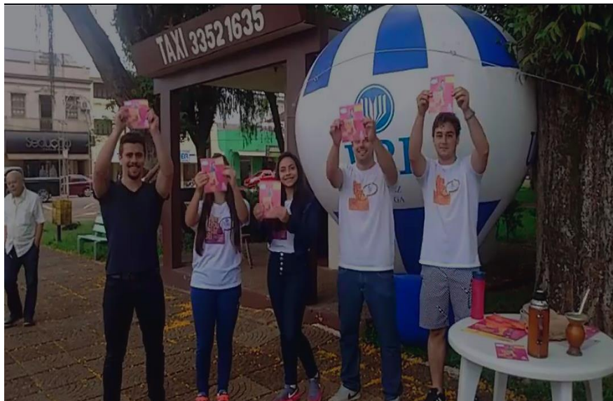
Campanha de Vestibular URI-SLG.