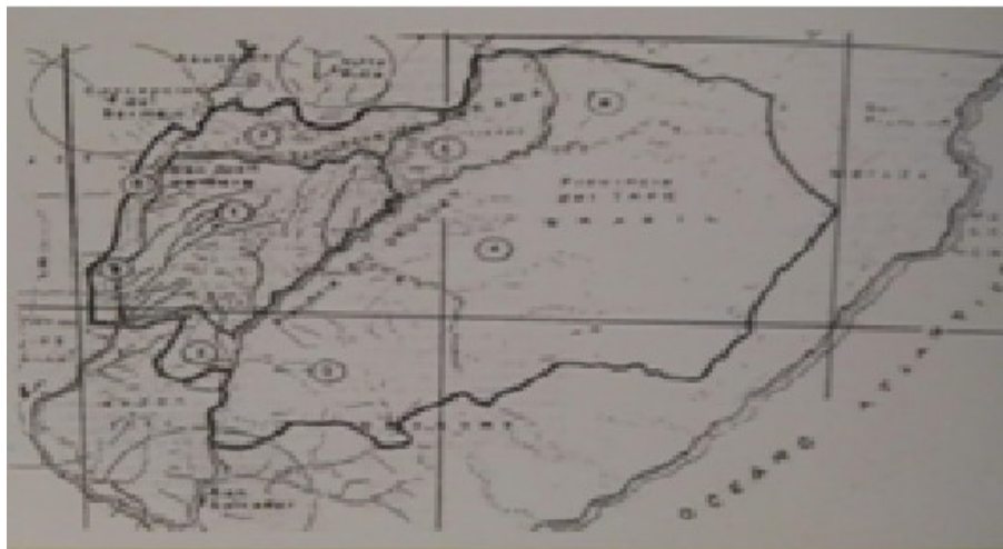
Grafico 3: Mapa fundacional de la provincia de Corrientes en 1588. (Salas & Piñeyro, 2014)

“La población de Corrientes se caracteriza desde su fundación, el 3 de abril de 1588, por un proceso de guaranización y de intenso mestizaje, entre indígenas y españoles” (Sajon, 1980).